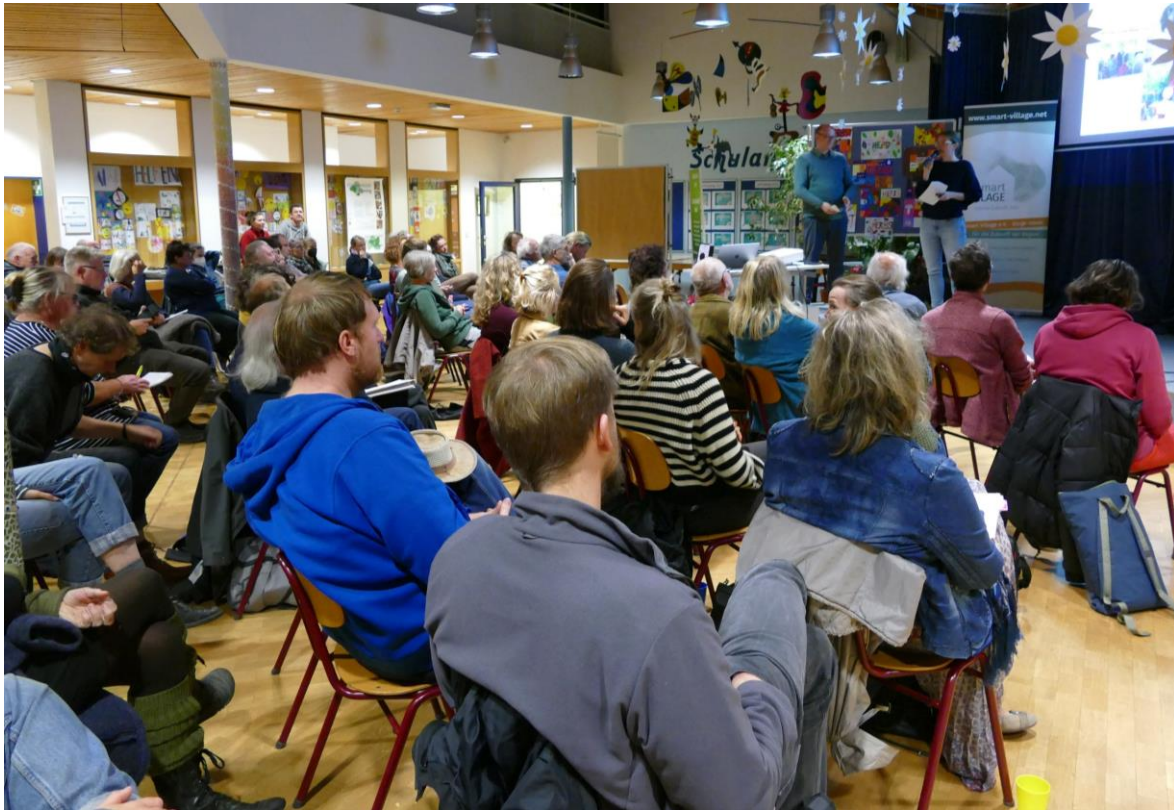
Abbildung 2: Klimawerkstatttreffen zum Thema Landwirtschaft & Wald am 2.11.2022